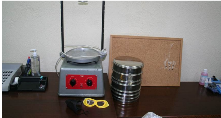
Tamizador eléctrico y columna completa de tamices.