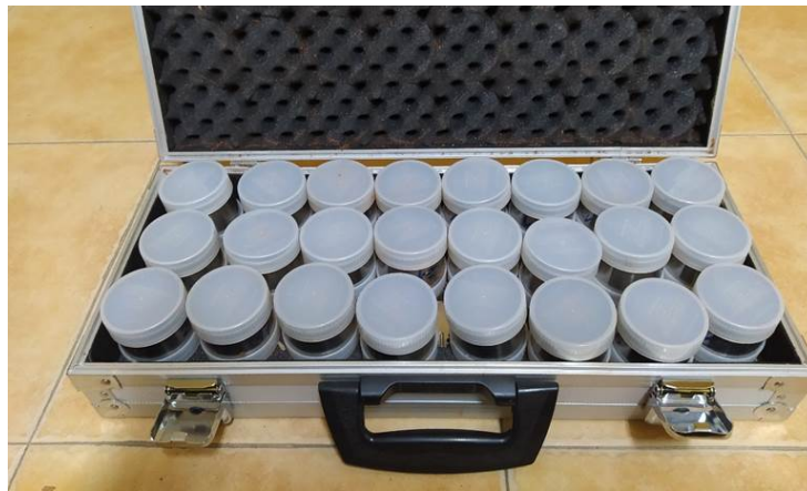
Equipo de perforación y muestreo de suelo con 24 anillos metálicos de 10 cm