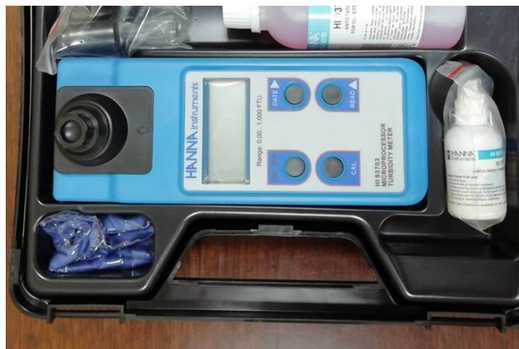
Turbidímetro de campo con baterías externas para mediciones in situ.