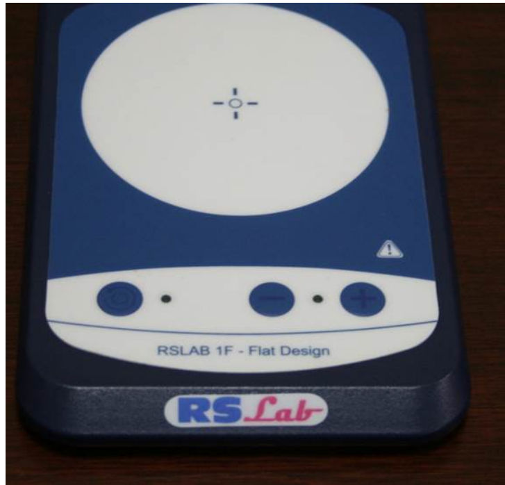
Agitador magnético de muestras.