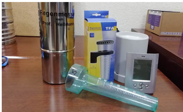
Pluviómetros y pluviógrafos.