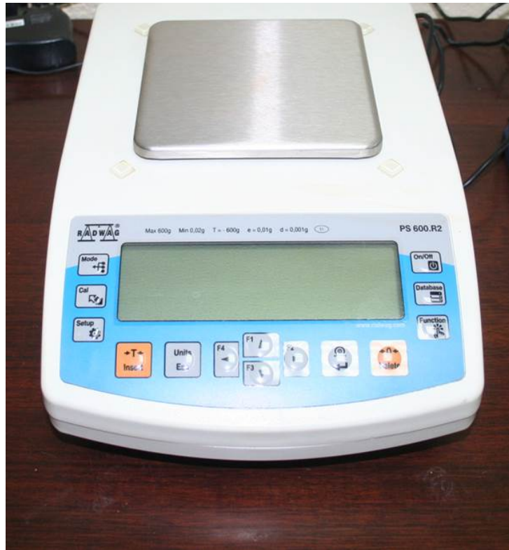
Balanzas de precisión (2 y 3 decimales de 600 a 6000 gr).