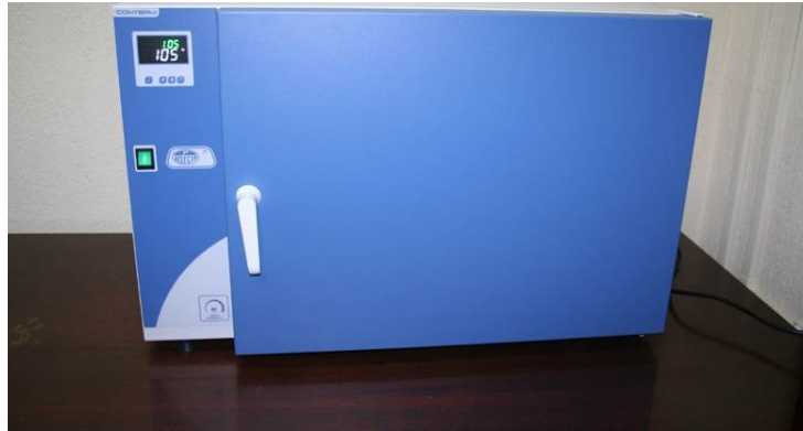
Estufa eléctrica (volumen 55 L).