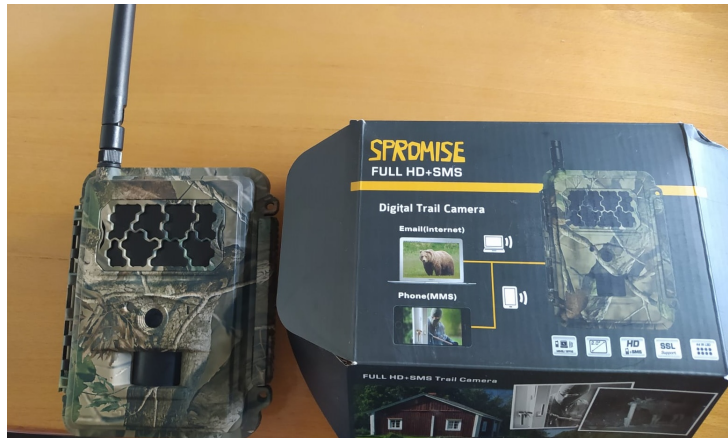
2 cámaras de fototrampeo (foto-video para animales). Resolución: 5,0 Mp.