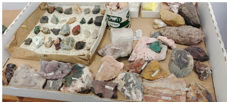
Colección de rocas y minerales.

4 estaciones meteorológicas en línea Holfuy para la medición de las siguientes variables meteorológicas y bioclimáticas: temperatura; humedad; precipitación; intensidad de la precipitación; sensación térmica; punto de rocío; velocidad y dirección del viento; radiación e índice UV; radiación solar; vapotranspiración;