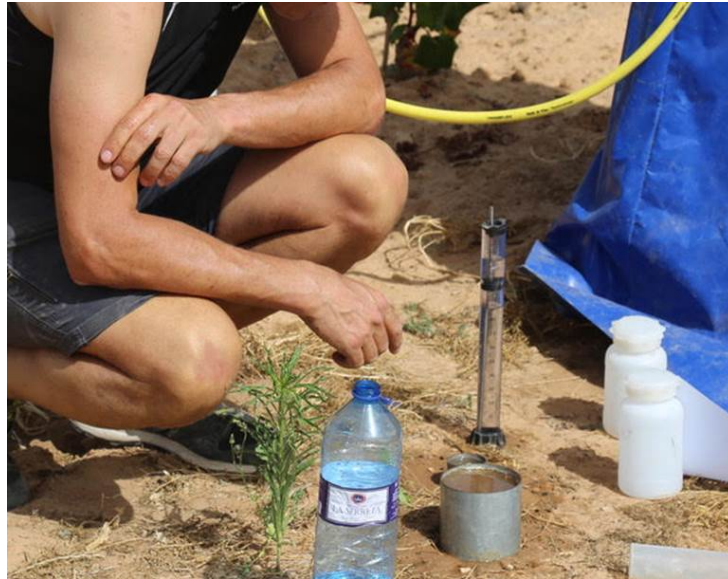
Infiltrómetro de minidisco.