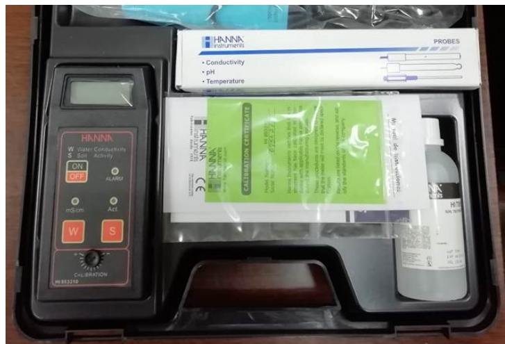
pHmetro y conductivímetro de mesa.