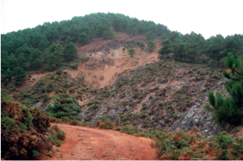
Figura 4. Restos mineros en el paisaje de la Fuenfría Alta (Sierra Bermeja)