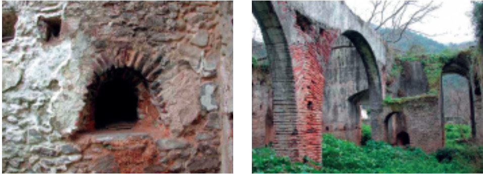
Figura 2. Horno e instalaciones de la Real Fábrica de Hoja de Lata de Júzcar