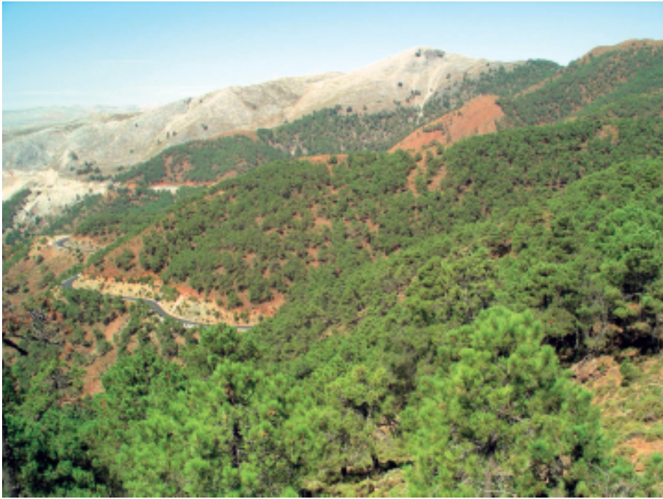
Figura 3. Contraste entre Sierra Blanca de Igualaja y Sierra Bermeja tras la deforestación propiciada en el siglo XVIII